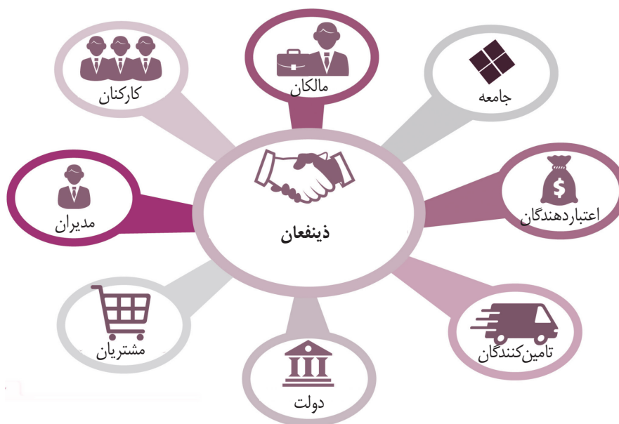
شکل ۱- ذینفعان دیداری

افزون بر این، دانشجویان می توانند ببینند که کدام داده ها